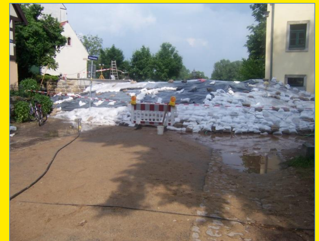
Sandsackdamm in Altmickten beim Elbehochwasser Juni 2013

Aufbauanleitung für einen Sandsackdamm zum Schutz vor Elbehochwasser mit Wasserständen von 700 bis 900 cm Pegel Dresden